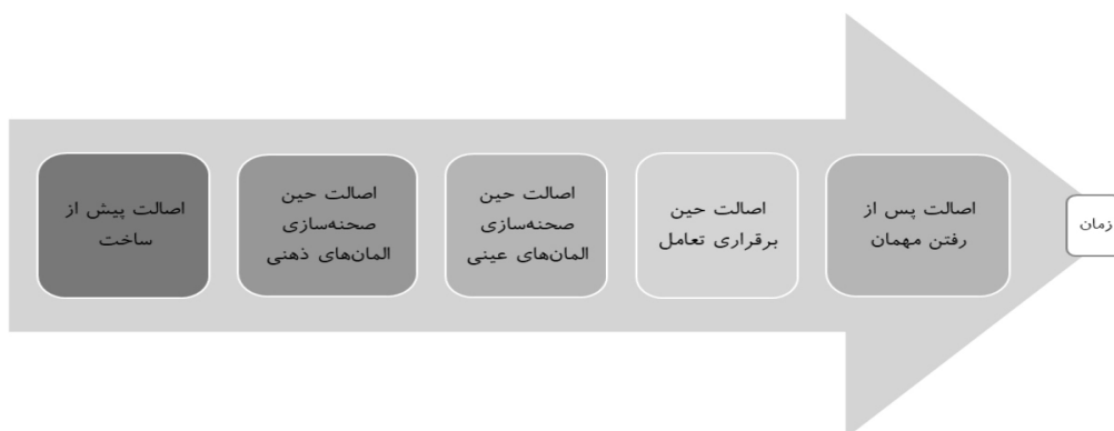
شکل ۱: فرایند عرضه اصالت در اقامتگاه بوم‌گردی براساس زمان عمر اقامتگاه

در این مطالعه نیز، اگرچه همه مقولات ماتریس تحلیل دارای زیرمقولات بودند، برخی از زیرمقولات در قالب هیچ‌یک از مقولات ماتریس تحلیل نگنجیدند. بنابراین، مقولات جدیدی با روش استقرایی از متون استخراج شدند. در نهایت، ۵ مضمون از بین ۳۵ مقوله استخراج شده کشف شد که در جدول ۲ ارائه شده‌اند.